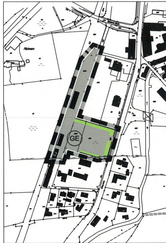
Änderungsplan M 1:5.000